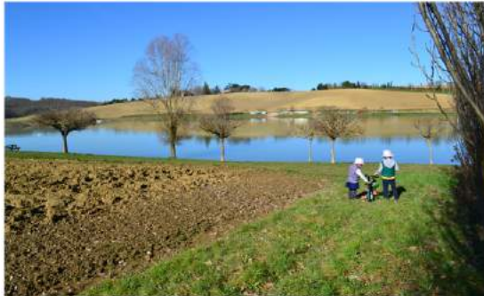
Tour du lac du Laragou à vélo