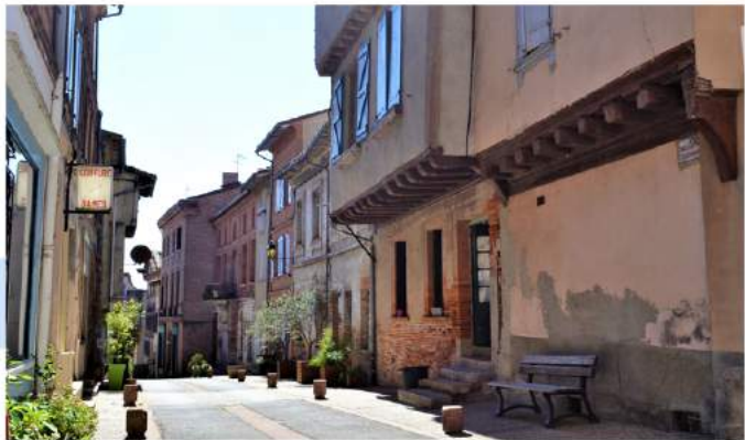
Les ruelles de Verfeil