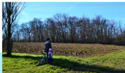
Promenade à la campagne en famille