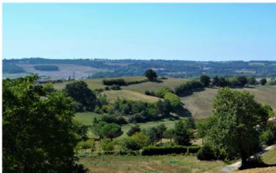
Point de vue sur la campagne Verfeilloise