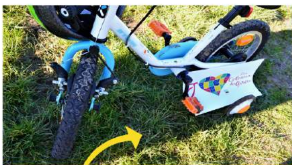
Thème : Zoom sur...

Tu peux utiliser les visuels du concours pour les intégrer à tes photos ou dessiner le tien à l'aide du "cœur coloriage" !