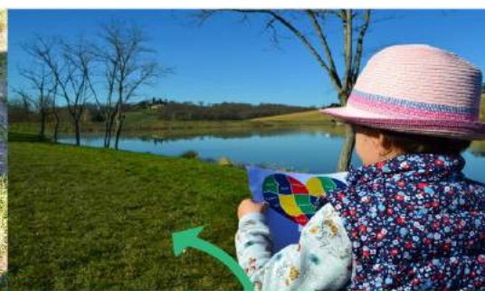
Thème : Paysage