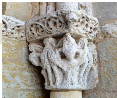
Chapiteau du porche de l'église de Gémil