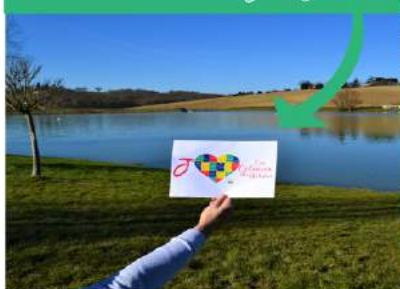
Thème : Paysage

"Cœur coloriage" et visuels "J'aime les Coteaux du Girou" disponibles en téléchargement sur : www.cc-coteaux-du-girou.fr (espace Concours Photos)