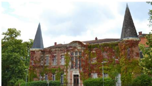
Château de Montastruc-la-Conseillère