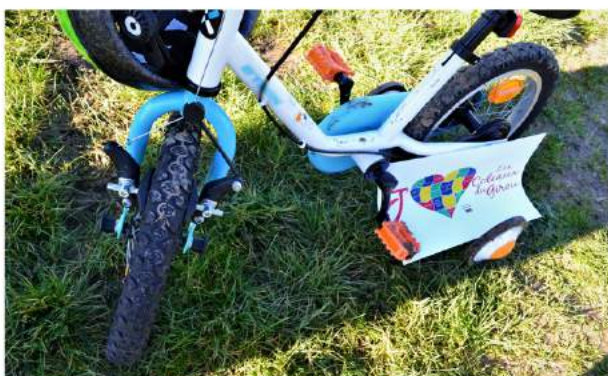
Balade à vélo en Coteaux du Girou

Gros plan sur des individus (merci de veiller à rendre les visages non apparents).