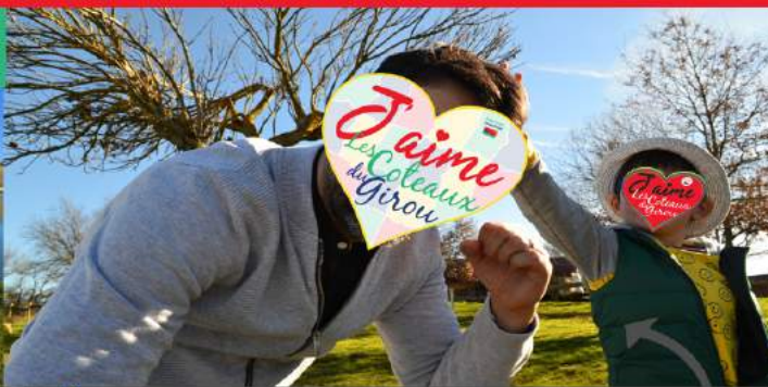
Thème : Zoom sur...

Un moment de complicité familiale capturé, au premier plan.